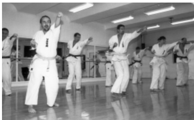
Ashihara Karate Frederiksberg dojo som vi kender den idag